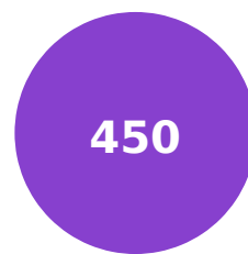
Nombre des étudiants enseignés